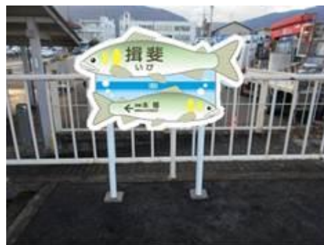
揖斐駅ご当地駅名標（イメージ）