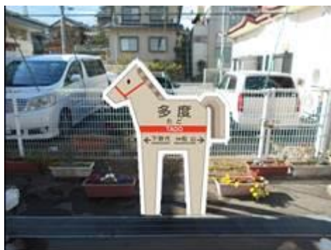
多度駅ご当地駅名標（イメージ）

沿線7市町に在住する小学校1年生を対象に、養老鉄道が乗り放題の年間無料パスを配布します。