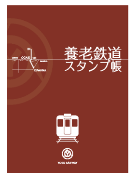
スタンプ帳（イメージ）