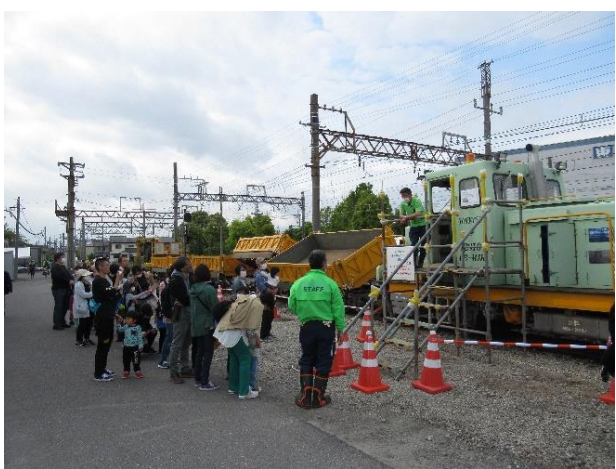
モーターカー見学