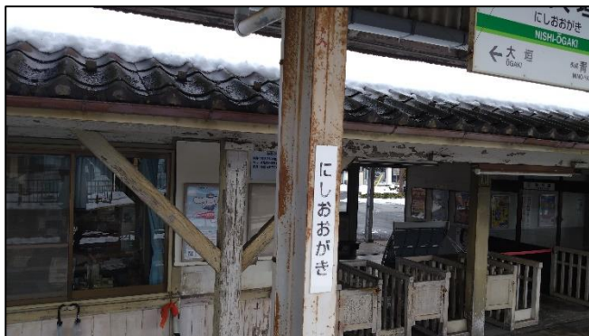
現在の駅名標設置状況