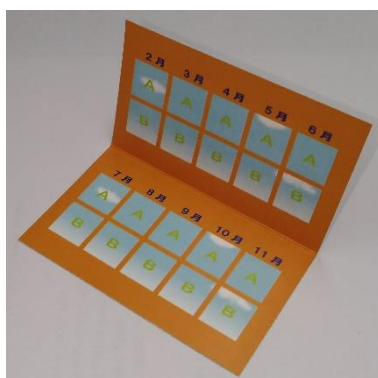
ポイントカードイメージ