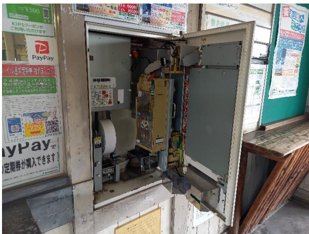
自動券売機の裏側