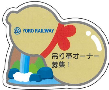
表 (メッセージ: 21文字まで)