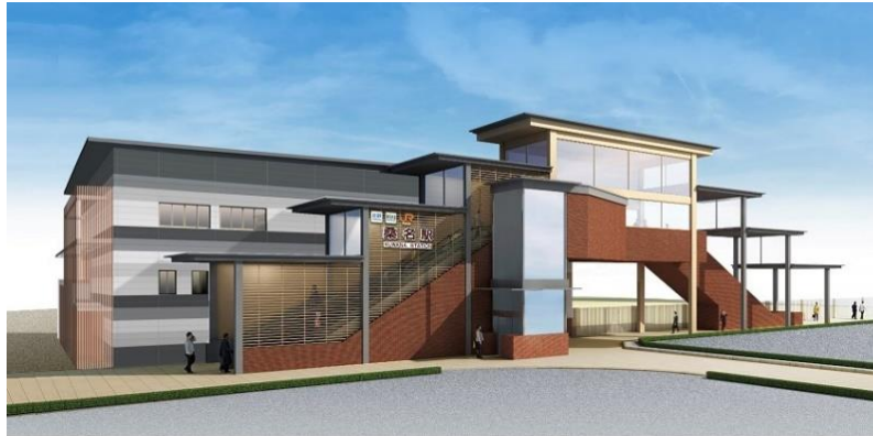
桑名駅自由通路(西口)