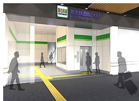
養老鉄道入口（自由通路接続箇所）