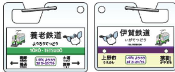
記念品B【アクリルカラビナ】(両面) (スタンプ6つ)