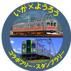
記念品A【缶バッジ】 (スタンプ4つ)